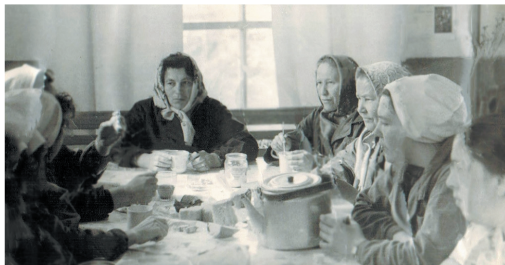
В бытовке на обогреве