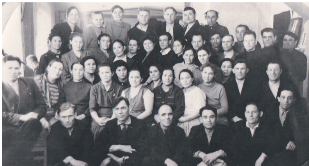
Конференция лучших тружеников рыбозавода

Славный путь прошел Нижнеангарский рыбозавод за 95 лет! Многие пришлось пережить его коллективу: и период становления, и величайшие трудности в годы Великой Отечественной войны, и реконструкции. А ведь за всем этим стояли люди. Именно их самоотверженный труд давал возможность добиваться хороших производственных показателей.